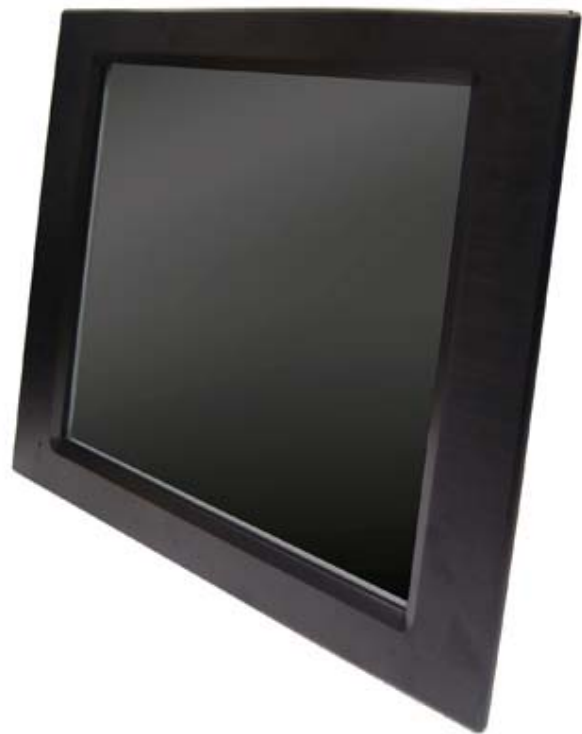
WLP-7821-17/19" (パネル・マウントタイプ)